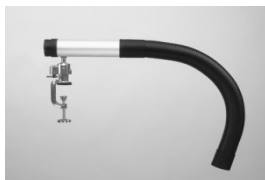
Extraction arm 3046/3446*

All arms can be ordered with a wall bracket, except for *