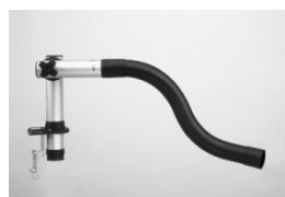
Extraction arm 3015/3415

Extraction arm 3046 incl. ball joint and 700 mm flexible hose. Extraction arm 3446, as 3046 but with air valve.